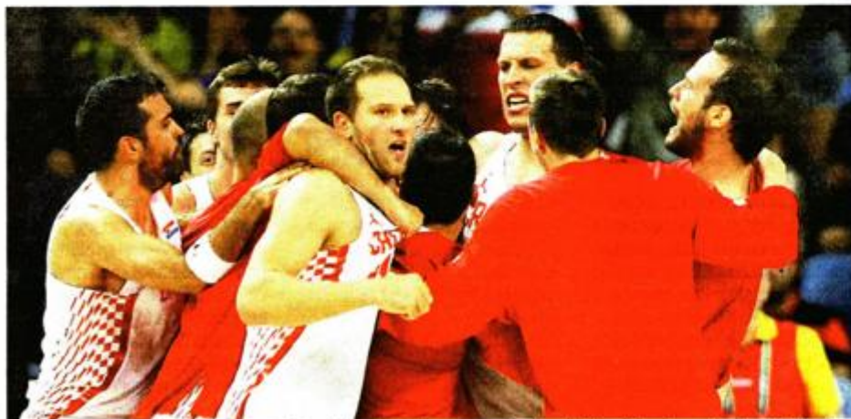
Aco je postavio hijerarhiju unutar momčadi i onda pustio igrače, što se pokazalo najboljim rješenjem, rekao je o košarkašima

- Sustav bi u Hrvatskoj morao biti bolji. Naš je sustav sporta nesređen, odnosno ima improvizaciju. Na taj način ozbiljan sustav, posebno na olimpijskoj razini teško može djelovati. Zbog toga su mnogi naši sportaši imali silne prepreke uopće se kvalificirati. Većina njih koji su došli u Rio u tome su uspjeli i dokaz tomu je tih 10 medalja. Za neke ćemo sportaše reći da ih je